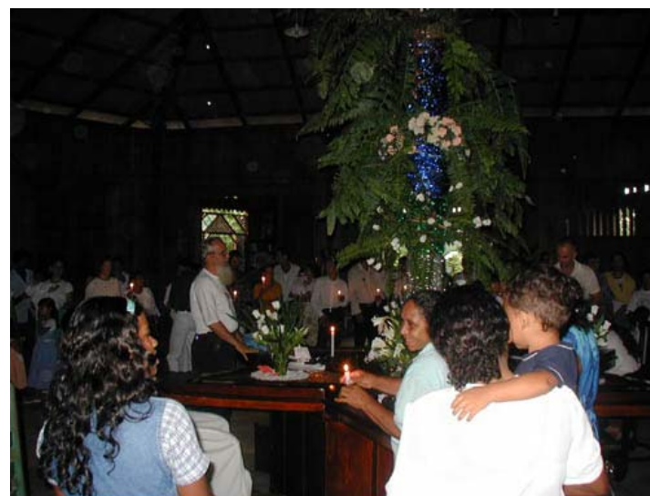
The "High Priest" performing the big baptism ceremony. I managed to get in on it myself.