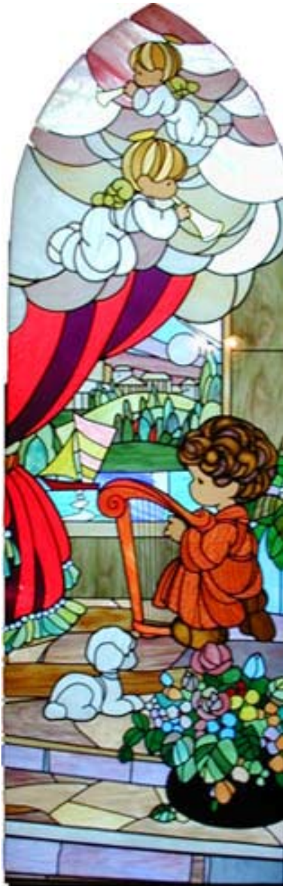
Precious Moments - Psalm 25