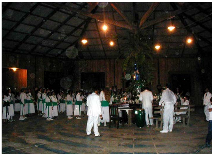
A festival night work. Dancers are arranged radially, in 6 sections: 3 for men, 3 women, by age group and height